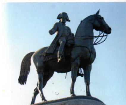
L'Empereur à cheval et en bicorne sur la place Napoléon de La Roche-sur-Yon.