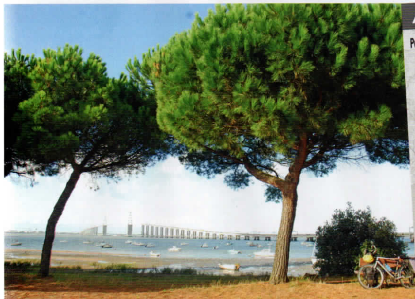
Vue sur le pont de Saint-Nazaire depuis Saint-Brévin-les-Pins.

que La Roche-sur-Yon, l'ex-Napoléonville cultive également le culte de l'Empereur via un parcours pédestre. Le canal, avec son office de tourisme installé sur une péniche, partage la ville en deux. Au sud, le centre-ville napoléonien, avec l'ancienne place d'armes, le lycée impérial et le quartier aux rues à angles droits. Côté nord, avec son imposant château des Rohan, la cité vaut aussi par ses vieux quartiers et ses maisons à pans de bois colorés.