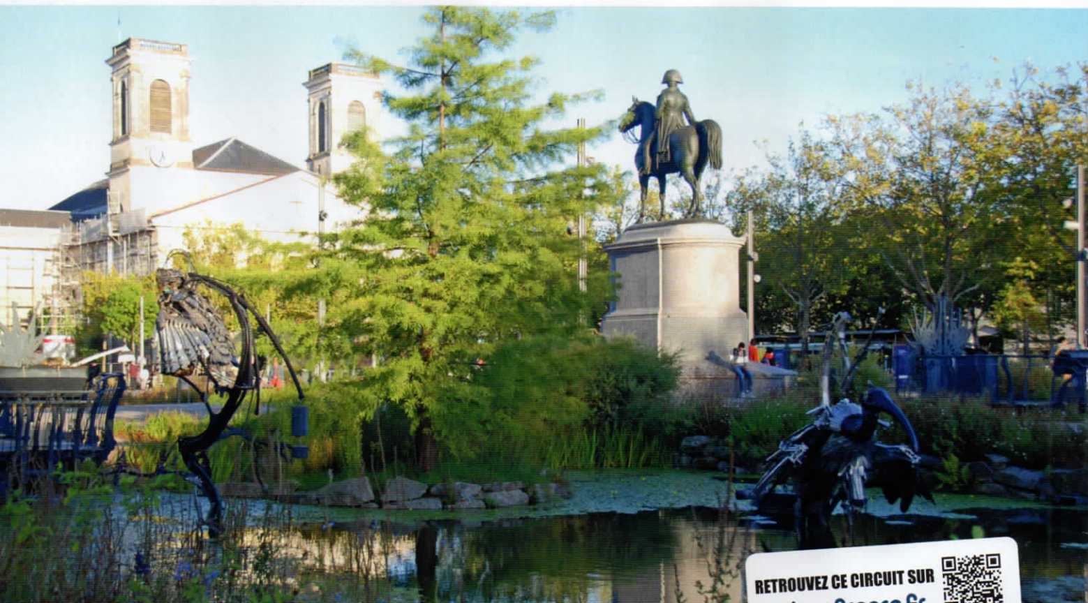
Bestiaire d'animaux d'acier sur la place Napoléon à La Roche-sur-Yon.

RETROUVEZ CE CIRCUIT SUR veloenfrance.fr