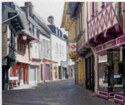
Les vieux quartiers de Pontivy.